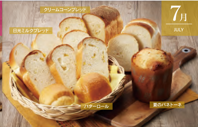
クリームコンブレッド

商品番号 A-202306 6月13日(火)締切! 果実(かじつ)セット 冷凍便 単月申込価格:4,000円(税・送料込) フルーツブレッド・チーズロード・日光あんパン2個・日光金谷ホテルピーナッツ