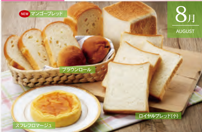
NEW マンゴーブレッド

商品番号 A-202307 7月11日(火)締切! 鳳梨(ほうり)セット 冷凍便 単月申込価格:4,000円(税・送料込) 夏のパネトーネ・日光ミルクブレッド・バターロール2個入・クリームコンブレッド