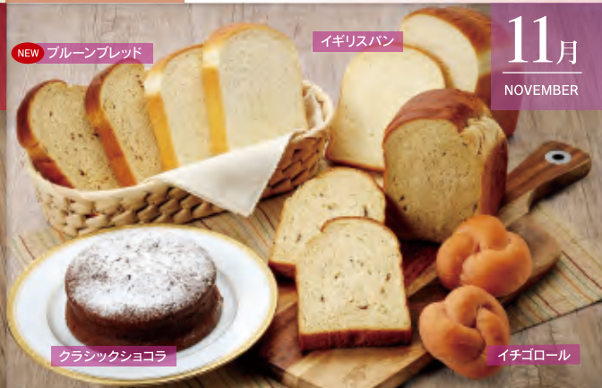
NEW ブルーンブレッド

商品番号 A-202310 10月10日(火)締切! 甘蕉(かんしょう)セット 冷凍便 単月申込価格:4,000円(税・送料込) チョコバナナブレッド・ハードトースト・パンクキンブレッド・ペークドチーズタルトミニ2個